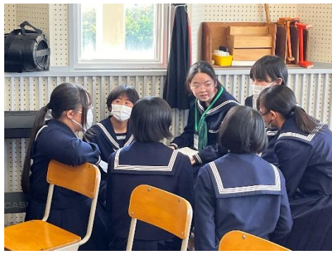
音楽の時間 2年女子はみんなで取り囲んで

先日、ラジオを聞いていたら、目が不自由な人が持つ白杖(はくじょう)の話をしていました。白杖は杖と違って道路の点字ブロックなどを確かめ歩くのに使うもので、雪が積もると全く役に立たず、2cmの降雪が限度とのこと。全くの無知だった私は、じゃあどうやって外出を？と思っているとヘルパーさん等の腕をもって外出するとのこと。じゃあヘルパーさんがいないと…。「外出はできません。冬の間は全く外に出ない人だっています。でも普通に歩きたいので、周りに助けて言えたらいいのにな。」と言っていました。障害を持っていらっしゃる方が住みやすい社会、優しい世の中にするには自分の考えや行動ひとつだと思います。